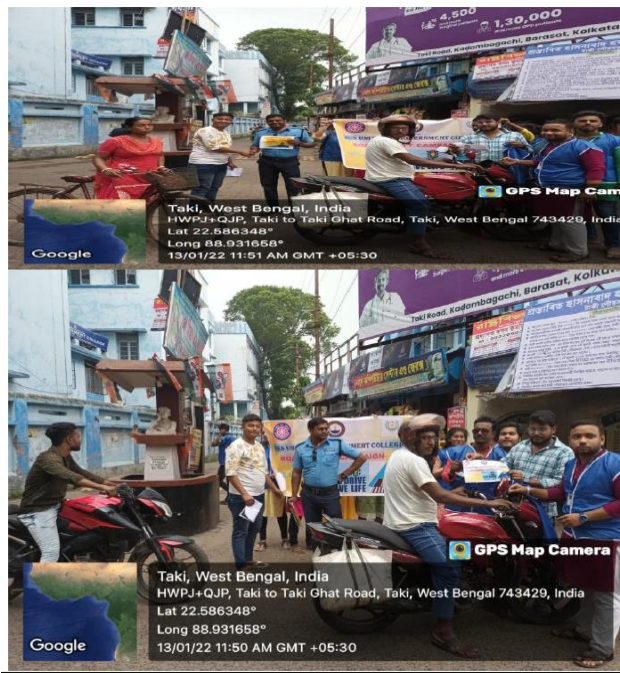
Awareness campaign on road safety on 13th January, 2022