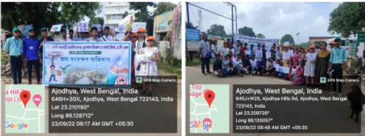
Water conservation awareness campaign at Purulia on 23 rd September, 2023