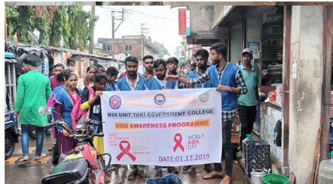
Involvement of students in AIDS Awareness Campaign on 1st December, 2019