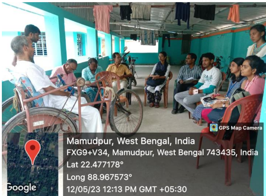
Student participation in the field study on challenges for differentially abled persons due to the effect of Amphan