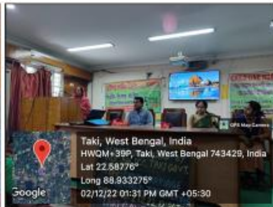
Awareness programme on Child trafficking and child marriage on 2 nd December, 2022