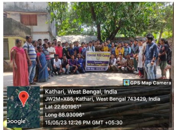
Awareness programme on human rights at adopted village ‘Kathri’ organized by NSS as a part of Special Camp on 15 th May, 2023