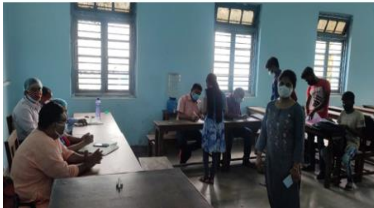
COVID Vaccination camp for students on 17th and 18th August, 2022