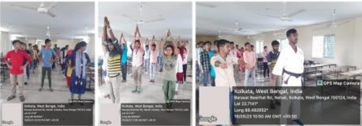
Participation of students in Yoga and karate training at College on 18 th May, 2023