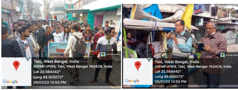
Student participation in eye donation awareness campaign on 5th January, 2023