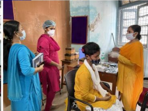
COVID Vaccination camp at college on 4th and 5th October, 2021

Vaccination Camp at Taki Government College on 17 th and 18 th October 2022